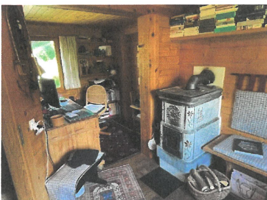
Stube mit Speckstein Ofen von 1949 und Ausblick