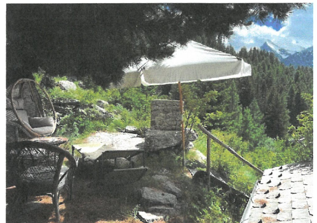
Grillplatz unter Arven